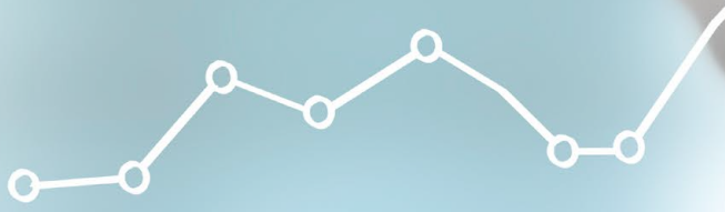
SCHÉMA - ACTE SOUS SEING PRIVÉ

Contrairement à la S.à r.l., la S.à r.l.-S permet à l'entrepreneur de constituer la société également sous seing privé . Dans un tel cas les statuts sont rédigés par les parties elles-mêmes. L'intervention d'un notaire dans la rédaction de l'acte n'est pas requise. La procédure de création d'une S.à r.l.-S sous seing privé est détaillée ci-dessous dans le schéma 2 - Acte sous seing privé spécifiquement y dédié. Comme cette démarche est caractéristique pour la S.à r.l.-S, nous nous concentrons dans cette brochure sur cette pratique.